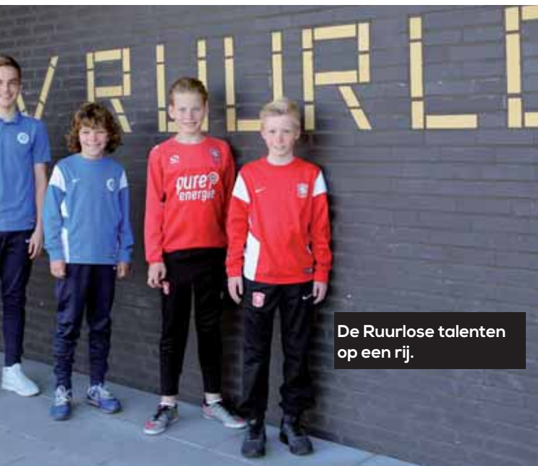
De Ruurlose talenten op een rij.

Wie wordt winnaar van het Karel Stegeman Toernooi 2017?